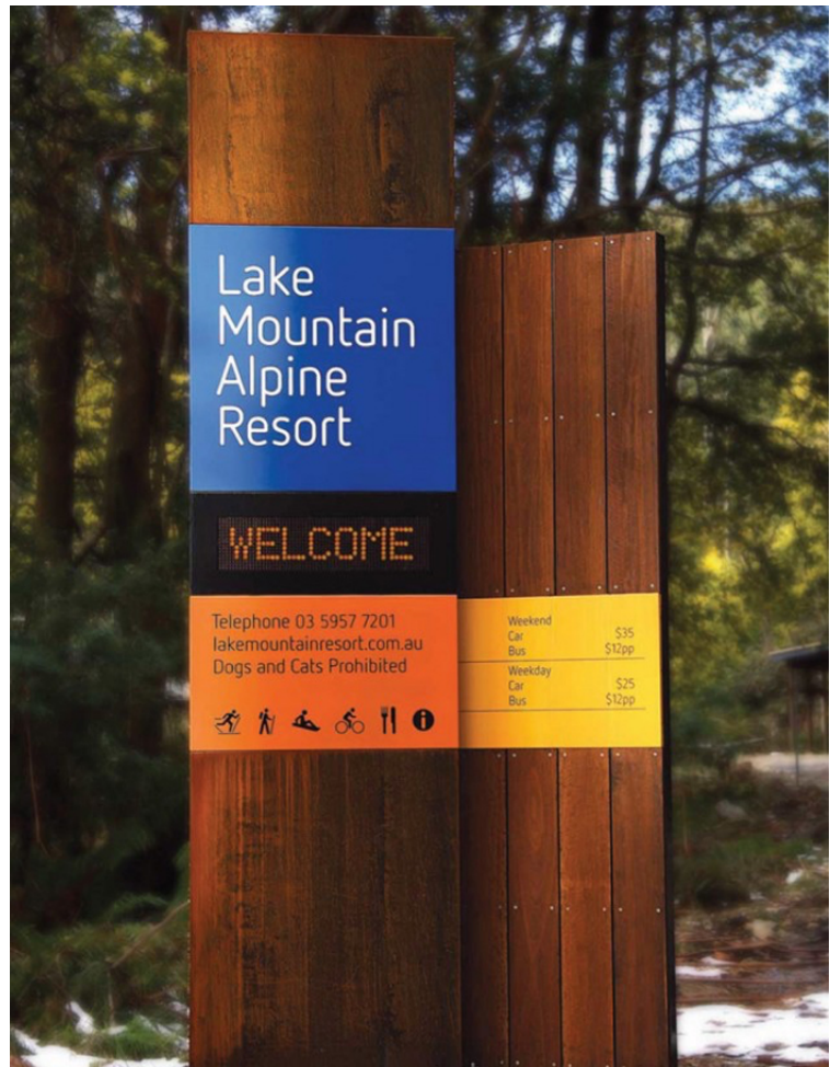
Lake Mountain Alpine Resort.