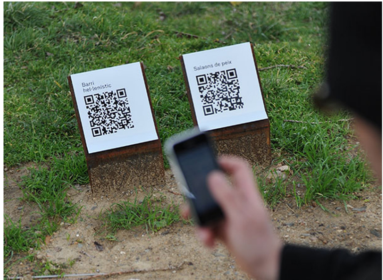
Patrimoni de Roses.