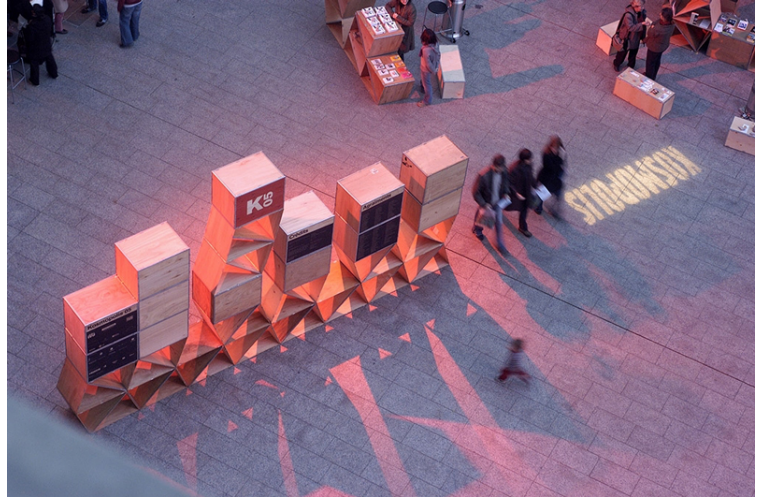
Festival de Literatura Kosmopolis. Agència: La Creativa