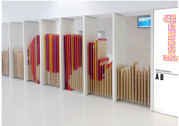
Hospital Sant Joan de Déu. Agència: Rubio Arauna Studio