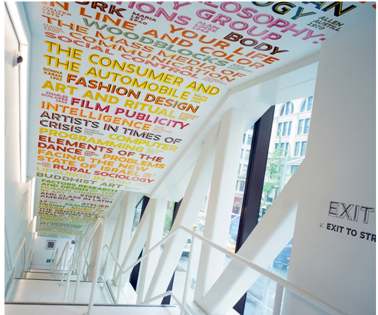
The New School. Agència: Integral Ruedi Baur