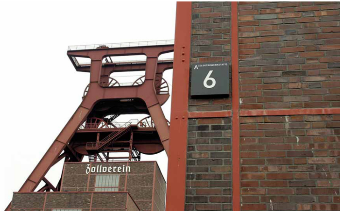
Zeche Zollverein. Agència: First Design