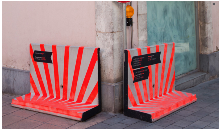
Festival Lumens.