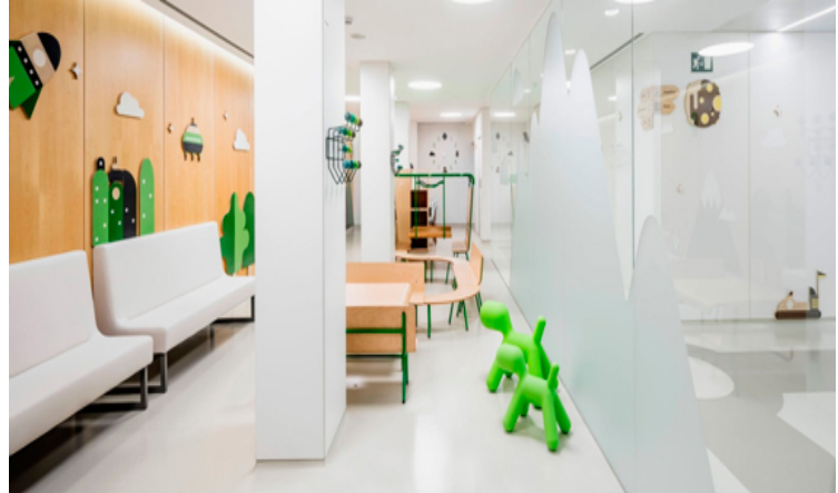
Parc d'Atencions de l'Hospital Universitari Vall d'Hebron. Agència: Toormix