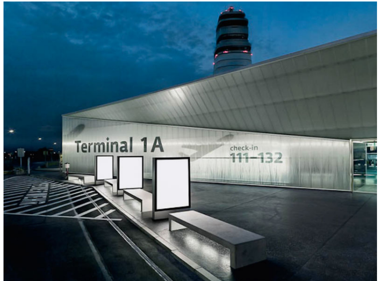
Aeroport de Viena. Agència: Integral Ruedi Baur