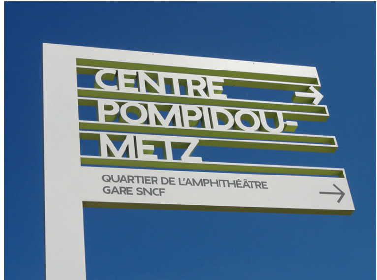
Ville de Metz. Agència: Integral Ruedi Baur