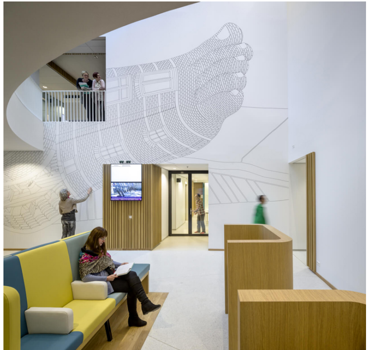
Healing Environment. Agència: Silo