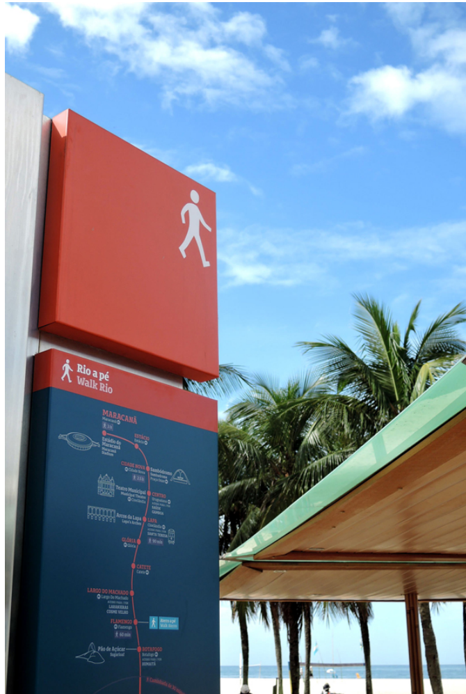
Walking Rio. Agència: Applied Wayfinding

Serveis de transport, espais patrimonials