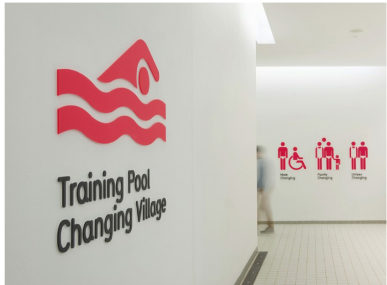
London Aquatics Centre. Agència: Cartlidge Levene