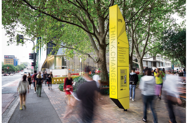
University of Technology Sydney. Agència: Frost Collective