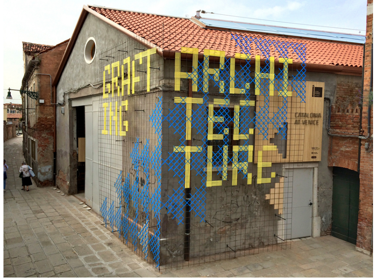
Grafting Architecture. Agència: Bildi Graphics