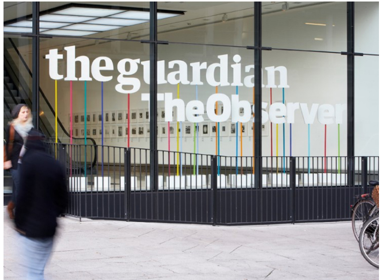
The Guardian. Agència: Cartlidge Levene