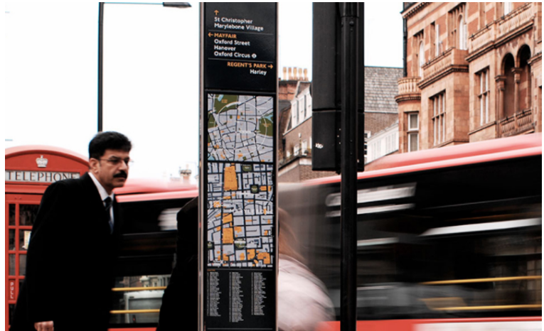
Legible London. Agència: Applied Wayfinding