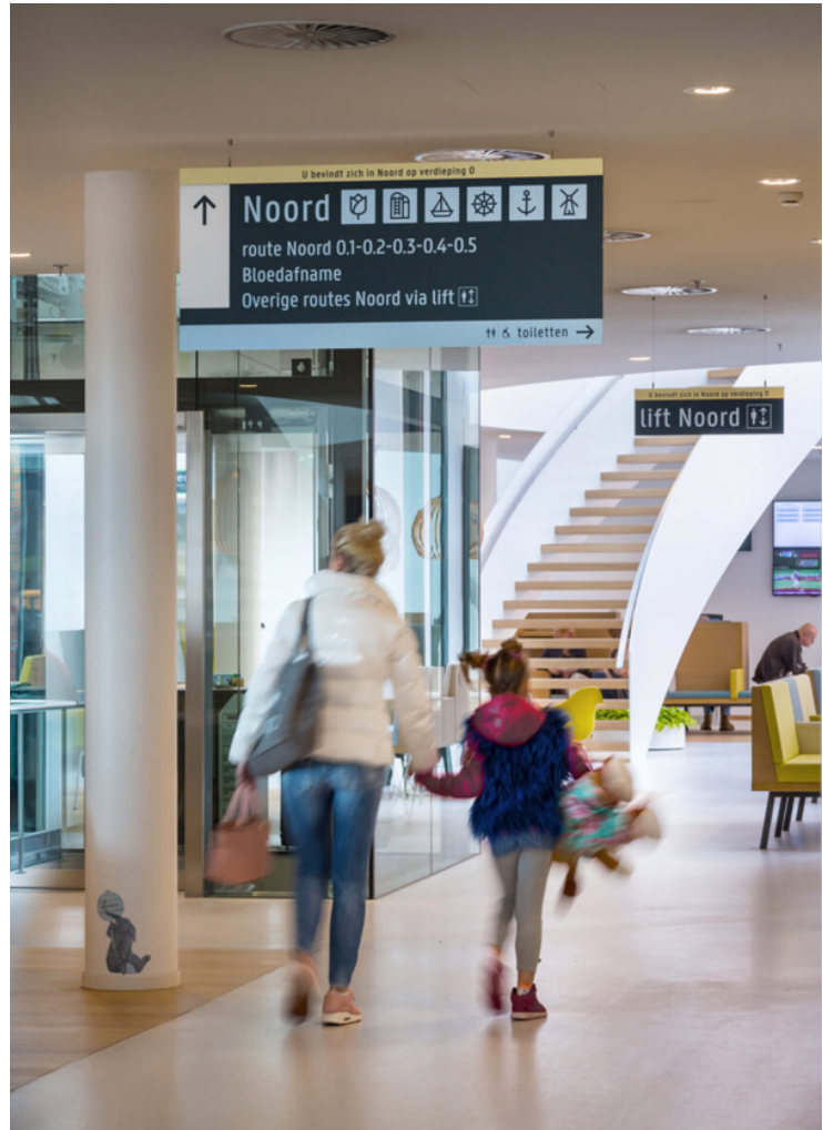
Zaans Medical Center. Agència: Silo