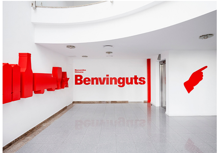
Fàbrica Damm. Agència: Rubio Arauna Studio