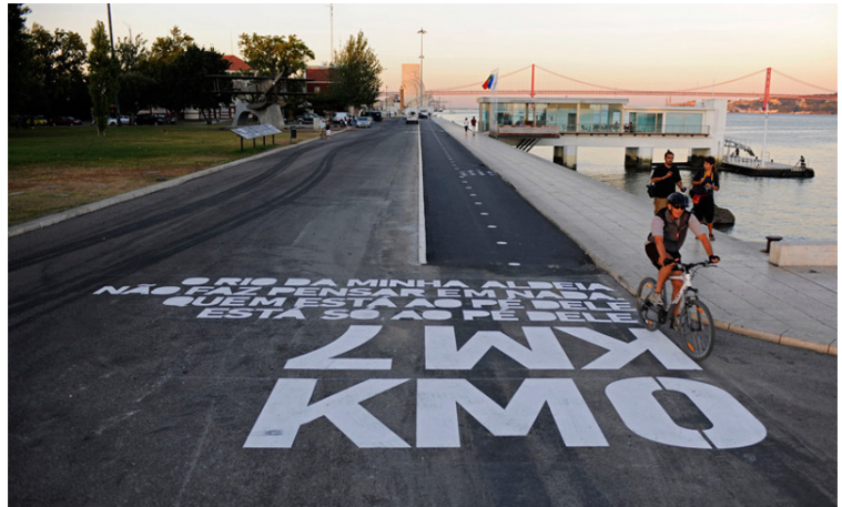
Lisbon Bikeway. Agència: P-06 Atelier