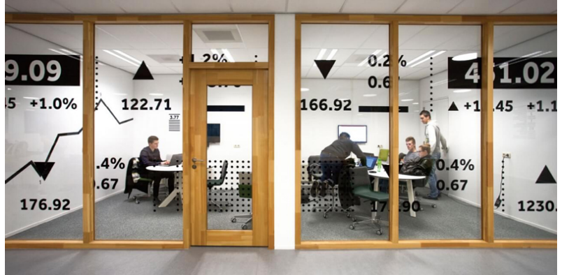
Facultat d'Estudis Econòmics, Universitat d'Eindhoven. Agència: Silo