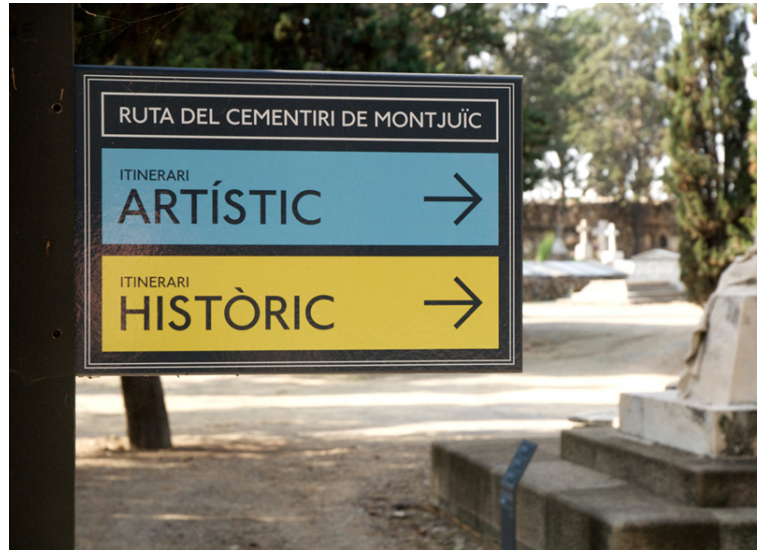
Ruta Cementiri de Montjuïc. Agència: Roseta Mus i Oihana Herrera