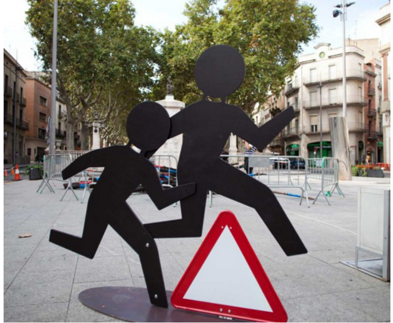
Children at Play, Urban Signage. Agència: Manel Grávalos, Visible