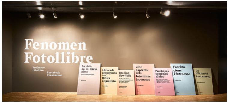
Exposició Fenomen Fotollibre. Agència: Toormix