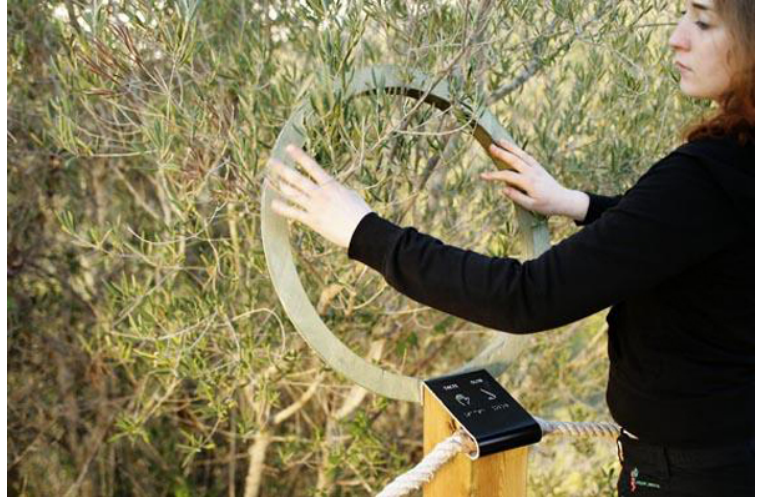
Itinerari Sensorial Can Grau. Agència: Inclusive Studio