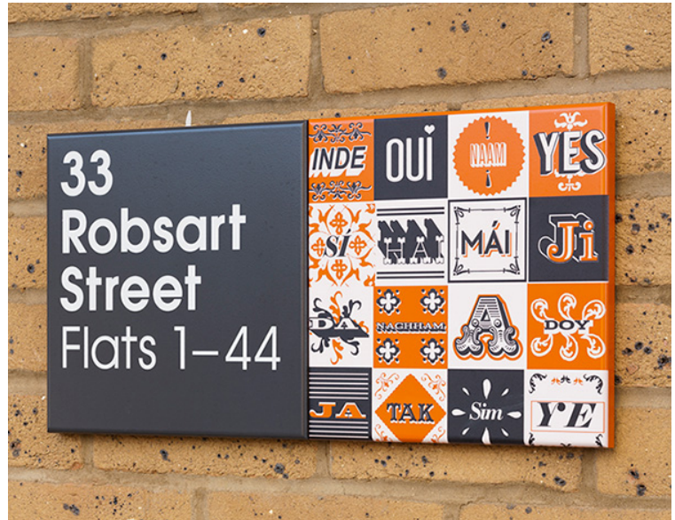
Stockwell Park Estate, UK. Agència: Hat-Trick Design