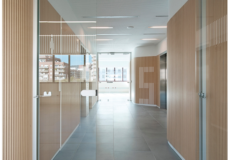
Edifici FIATC Diagonal. Agència: Rubio Arauna Studio