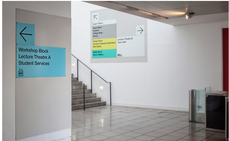
London College of Communication. Agència: Pentagram