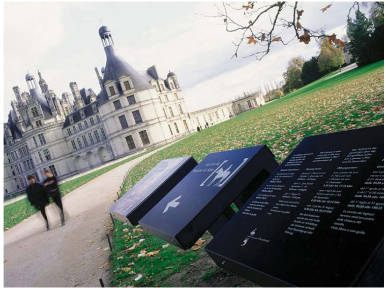
Château de Chambord. Agència: Integral Ruedi Baur