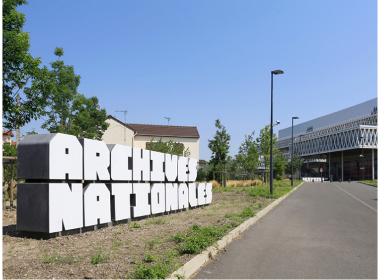
Archives Nationales. Agència: Integral Ruedi Baur