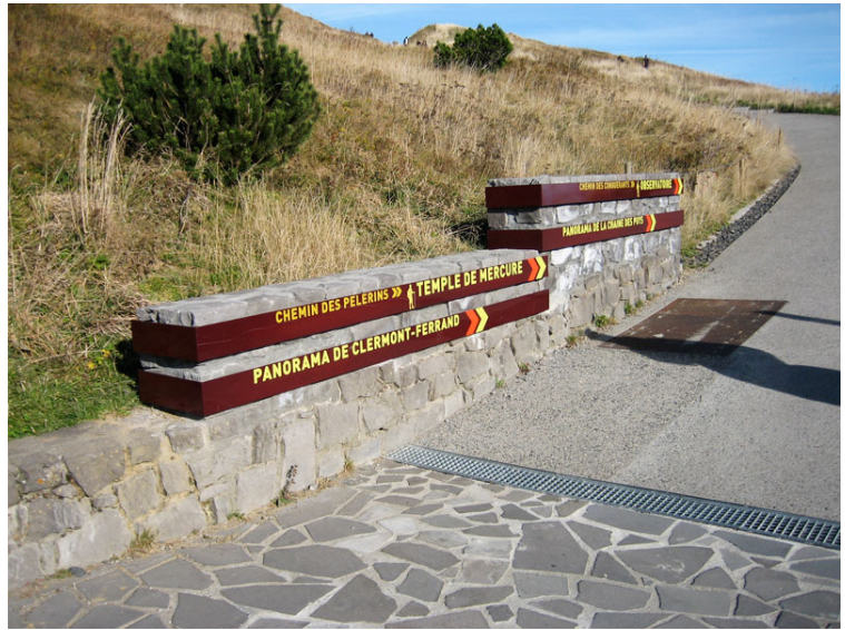
Puy-de-Dôme. Agència: Integral Ruedi Baur