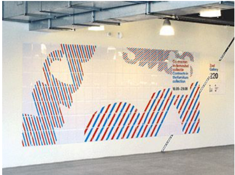
Stedelijk Museum. Agència: Experimental Jetset